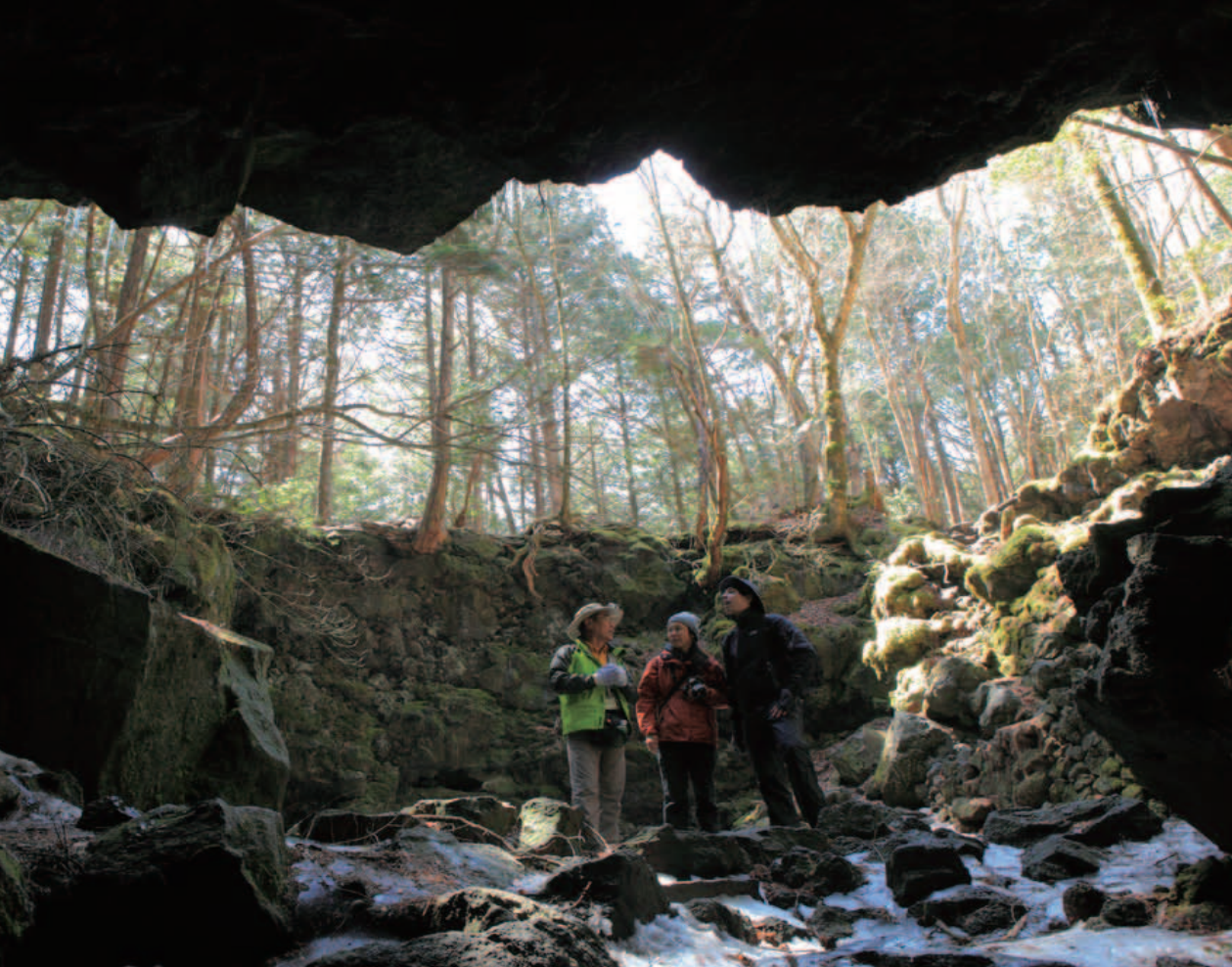
溶岩洞窟の天井が崩落した巨大な穴が富士風穴の入口だ